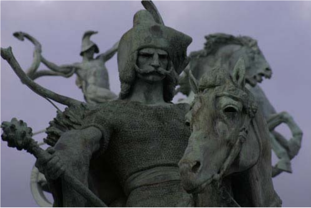
Kahramanlar Meydanı - Budapeşte