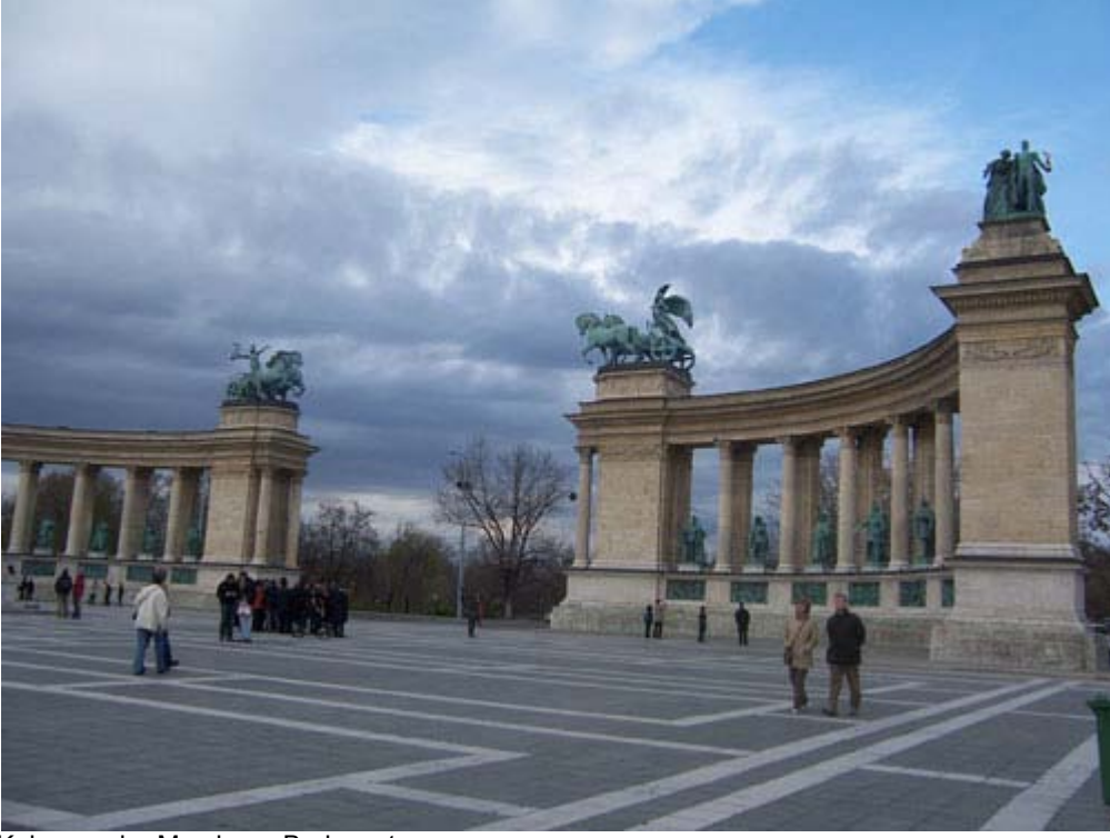
Kahramanlar Meydanı - Budapeşte