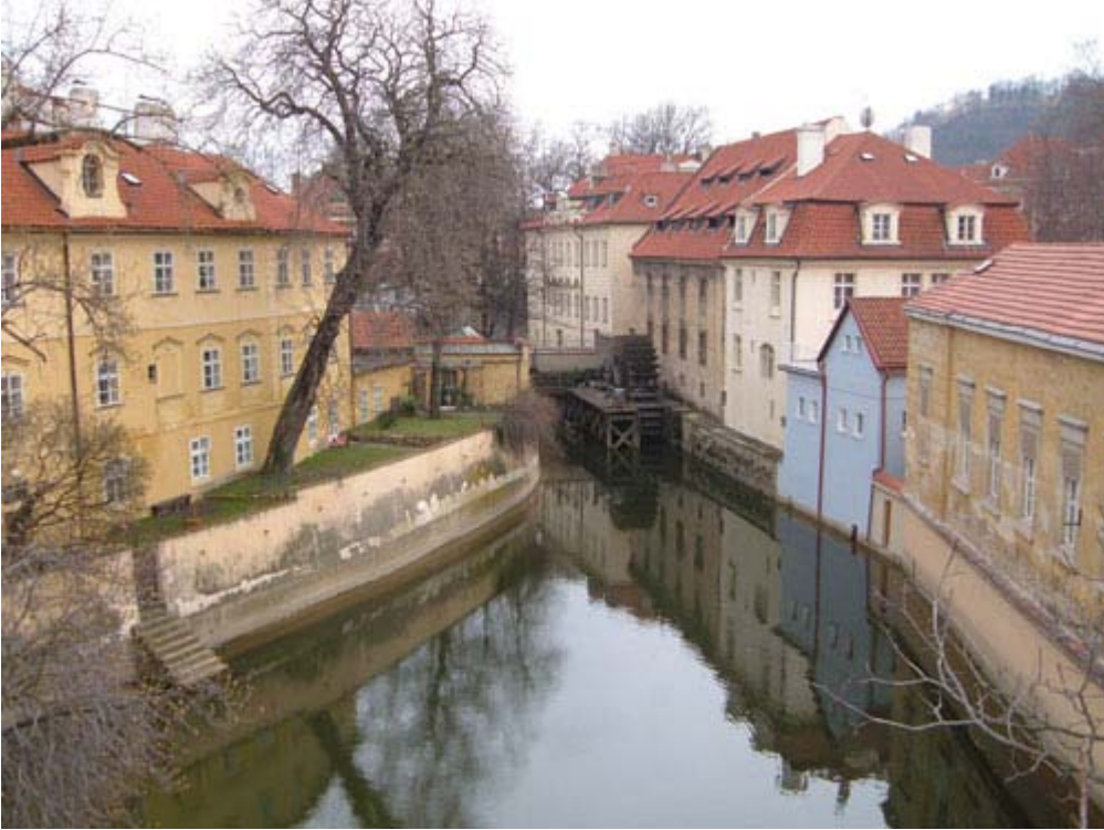
Karluv Köprüsü'nden Vltava Nehri - Prag