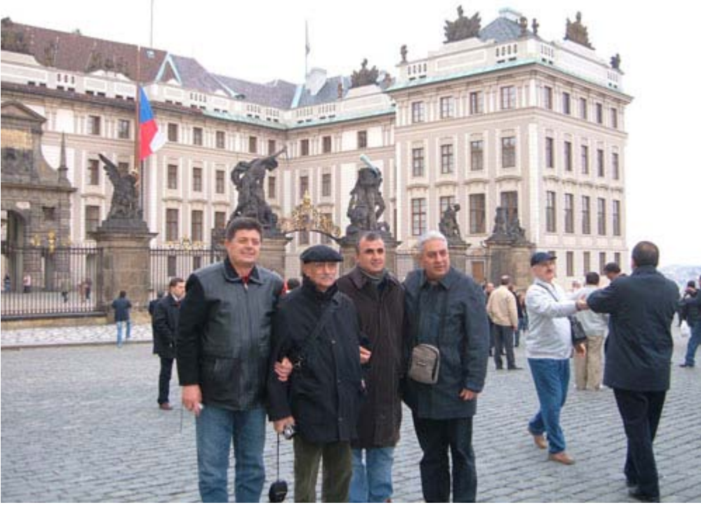
Başkanlık Sarayı - Prag