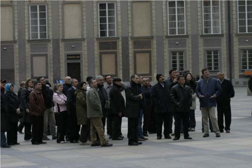
Başkanlık Sarayı - Prag